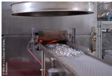
Matriçage Quinche, La Chaux-de-Fonds