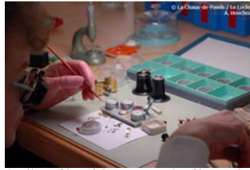
Ateliers Girard-Perregaux, La Chaux-de-Fonds