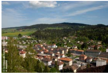
Vue aérienne du Locle