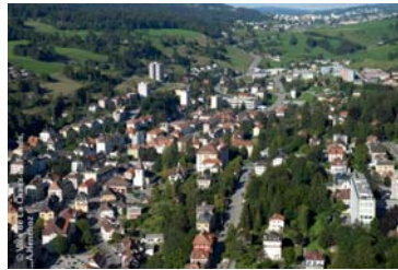
Vue aérienne du Locle