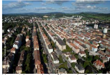
Vue aérienne de La Chaux-de-Fonds