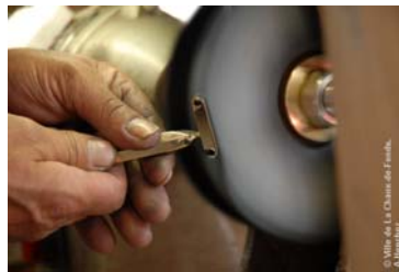
Manufacture Setco, La Chaux-de-Fonds