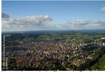
Vue aérienne de La Chaux-de-Fonds