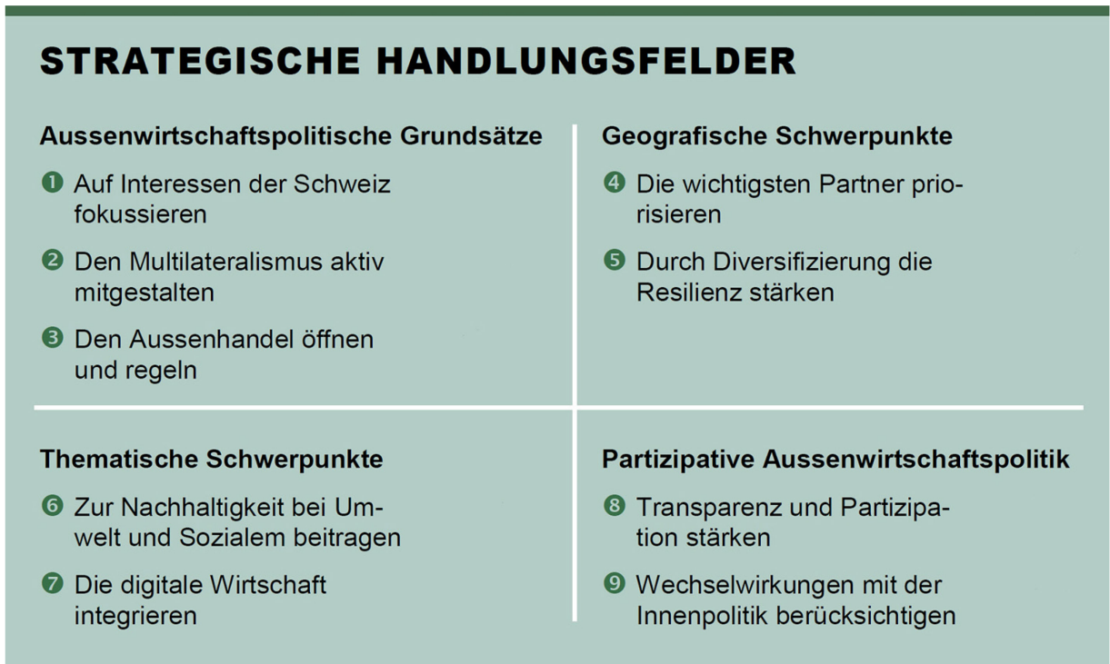
Abbildung 1: Strategische Handlungsfelder der Aussenwirtschaftsstrategie 2021