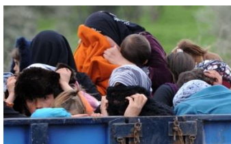
Réfugiés syriens près de la frontière turque