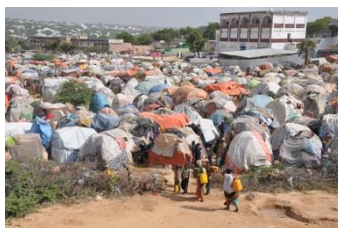
Camp de fortune accueillant des déplacés internes à Mogadiscio/Somalie