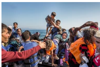
Flüchtlingsboot in Lesbos