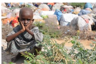
Informelles Camp von Binnenvertriebenen in Mogadishu/Somalia