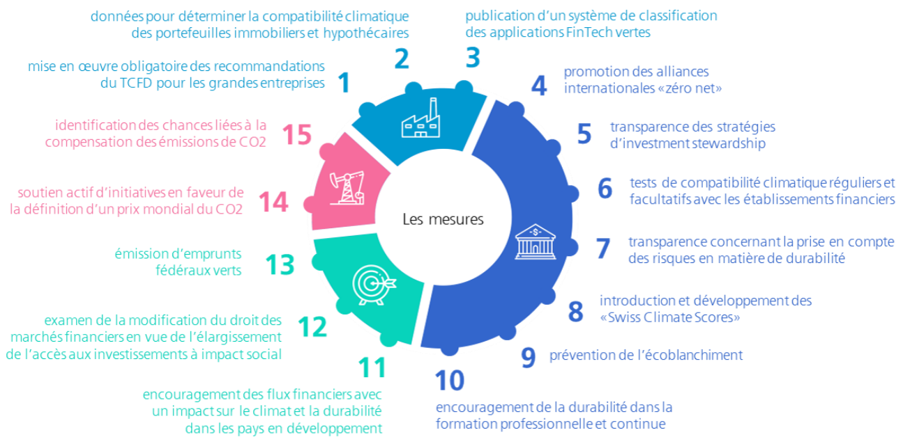
Illustration 1: Les mesures en vue d'assurer à la place financière une position de leader en matière de développement durable