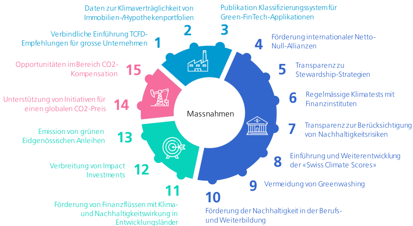
Abbildung 1: Massnahmen des Bundes für einen führenden nachhaltigen Finanzplatz