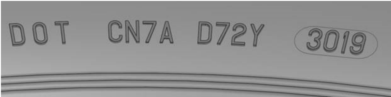
Illustration: numéro DOT complet et code hebdomadaire de production 3019

ATTENTION: seuls les pneus dont le numéro DOT complet correspond à l'action sont concernés et seront remboursés.