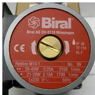
Figure 2: Plaque signalétique de la pompe

Si une plage de puissance (p. ex. de 35 à 43 W) est indiquée au lieu d'une valeur unique, on peut utiliser la valeur la plus élevée.