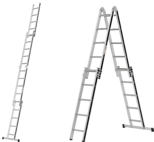
Teleskopleiter ALU-PRO 7006920

Abbildung links: Teleskopleiter in Anlegeposition