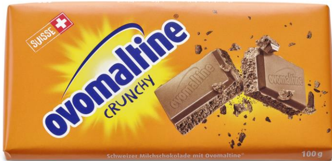
Tavoletta di cioccolato Ovomaltine 100 g