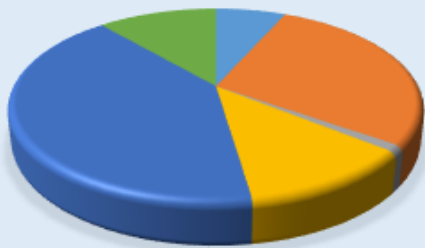
1538 (1598) PRODOTTI CONTROLLATI