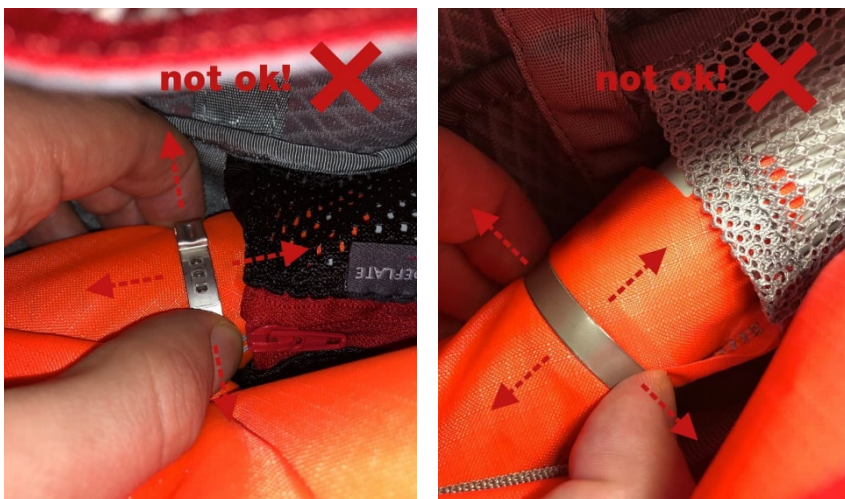
Abbildung: Mammut Protection Airbag System (PAS) bzw. Mammut Removable Airbag System (RAS)