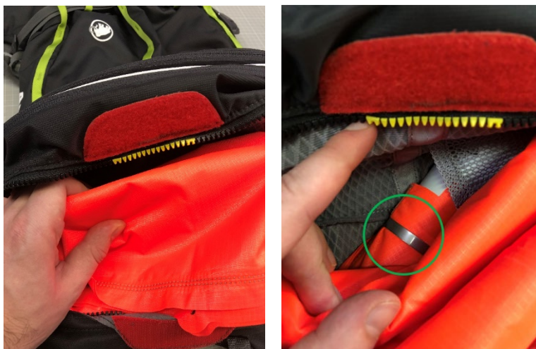
Abbildung: Mammut Removable Airbag System (RAS)