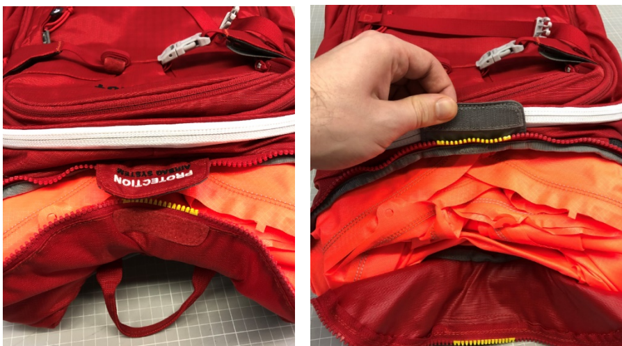
Abbildung: Mammut Protection Airbag System (PAS)

https://ch.mammut.com/service/user-manuals/avalanche-airbags/