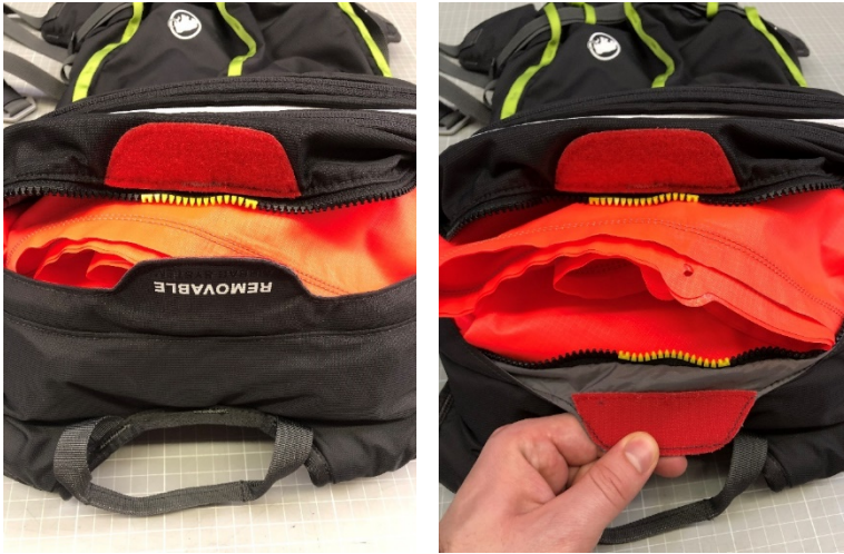
Abbildung: Mammut Removable Airbag System (RAS)

3. Hebe den gefalteten Airbag-Ballon vorsichtig auf die Seite, so dass der Klemmring (grüner Kreis in Abbildung) zwischen Ballon und Airbag Inflation-System gut sichtbar ist