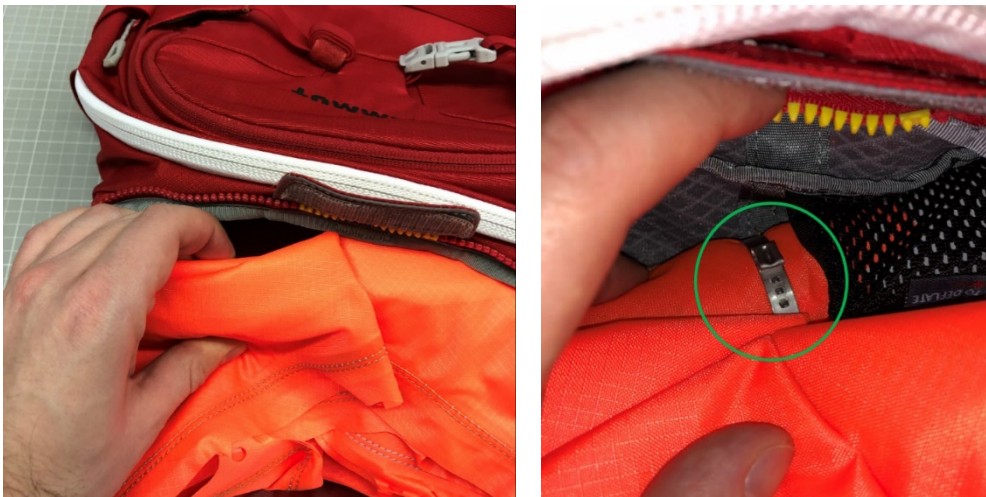
Abbildung: Mammut Protection Airbag System (PAS)

3. Hebe den gefalteten Airbag-Ballon vorsichtig auf die Seite, so dass der Klemmring (grüner Kreis in Abbildung) zwischen Ballon und Airbag Inflation-System gut sichtbar ist