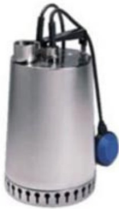
UNILIFT AP 12