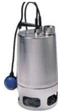
UNILIFT AP 50

Diese Pumpen wurden ausschließlich über den Fachgrosshandel vorrangig für eine gewerbliche Nutzung vertrieben. Insgesamt sind weniger als 300 Produkte, die betroffen sein könnten, in den Markt gelangt.