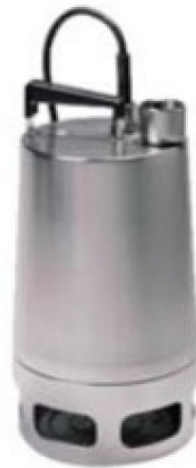
UNILIFT AP 35