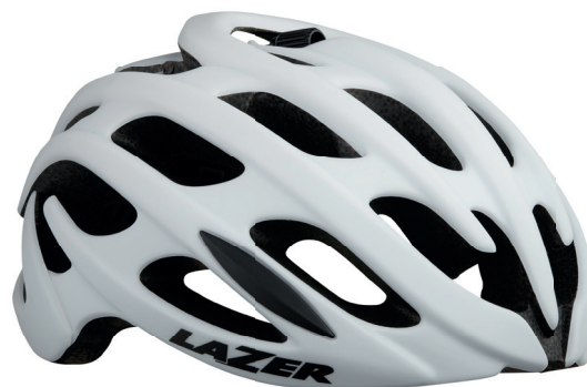
Lazer Blade / Elle