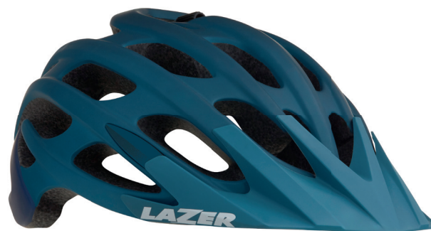
Lazer Magma / Jade

Wenn Sie einen der betroffenen Helme besitzen, setzen Sie sich bitte so schnell wie möglich mit uns in Verbindung, damit wir einen Austausch des Helms vereinbaren können. Die Ersatzhelme mit der Bezeichnung BLADE+ und MAGMA+ haben eine neue Riemenverankerung, die in Übereinstimmung mit den vorgeschriebenen Normen konstruiert ist. Sie verfügen über eine CE-Zulassung und lassen sich daran erkennen, dass ihre Artikelnummern auf „081“ oder „181“ endet.