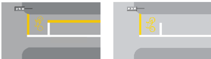
6.26 Zona di attesa per velocipedi (esempi; art. 75)