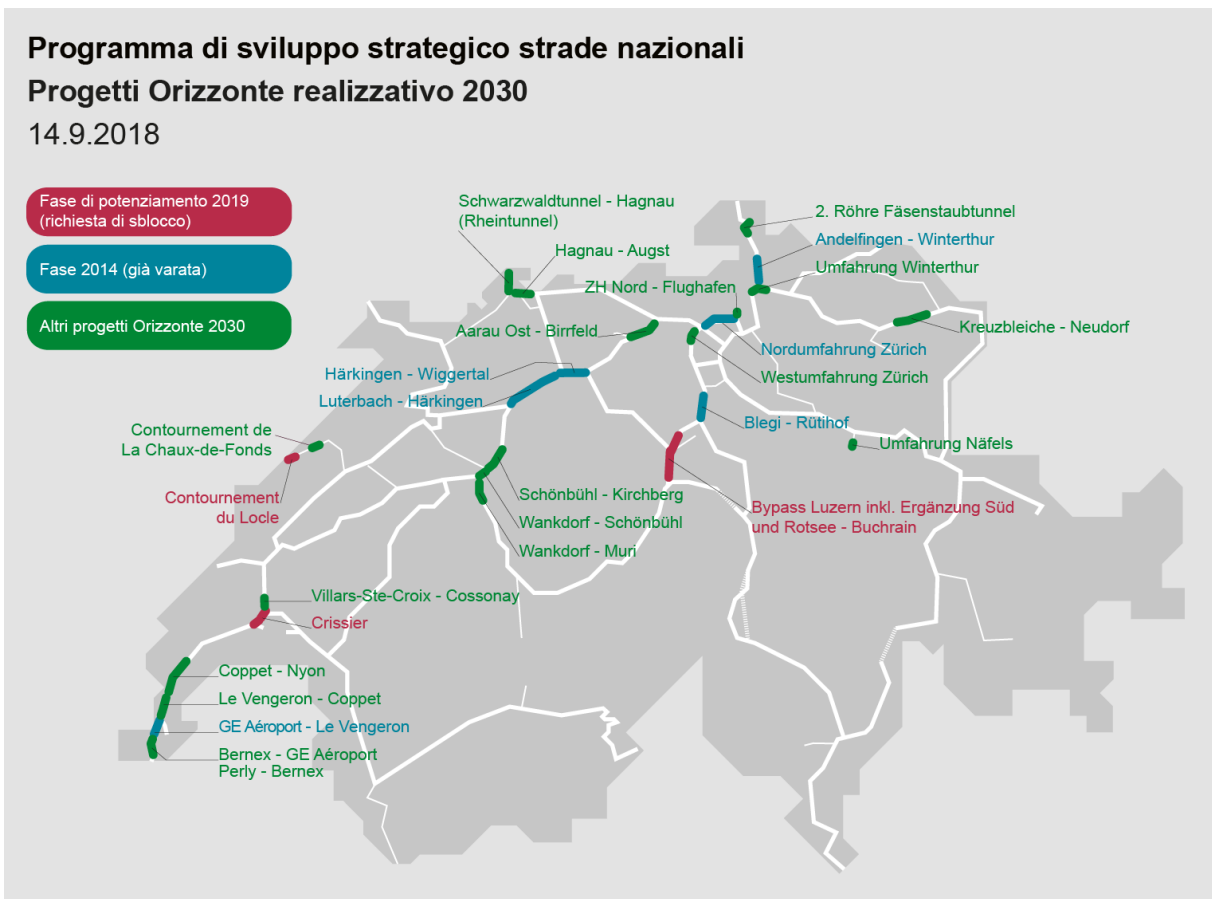
Progetti del PROSTRA assegnati all'Orizzonte realizzativo 2030

Il Consiglio federale intende preservare e migliorare la funzionalità della rete delle strade nazionali. Per eliminare il problema delle code occorre intervenire su determinati punti nevralgici, ampliando in particolare le infrastrutture degli agglomerati. Lo strumento è il Programma di sviluppo strategico (PROSTRA) , l'obiettivo investire 14,8 miliardi di franchi entro il 2030. Nell'immediato il Parlamento sarà chiamato a decidere in via definitiva su quattro progetti della fase di potenziamento 2019 .