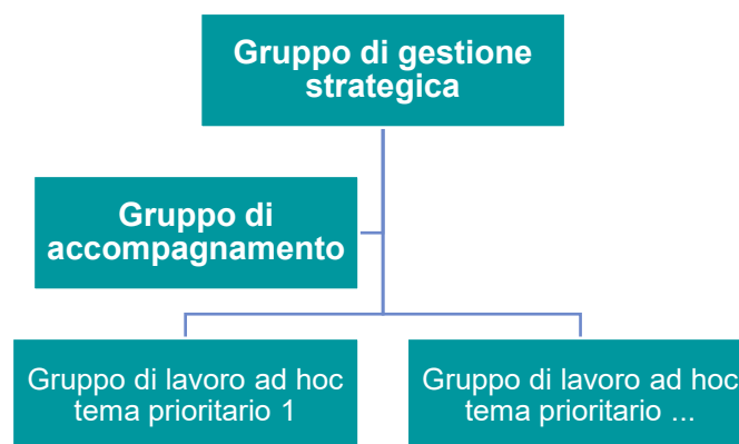
Grafico 2 Struttura per la gestione strategica e l'accompagnamento delle misure di attuazione

Per accompagnare i lavori di attuazione si propone il proseguimento delle forme di collaborazione collaudate, seppur con una netta riduzione del numero dei gruppi di lavoro rispetto al periodo 2014–2018.