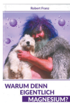
Warum denn eigentlich Magnesium? CHF 17.00

Die Robert Franz Naturversand GmbH hat sich dazu entschieden, sämtliche Produkte „NEM Vitamin B Komplex (Vitamin B50 Komplex)“ zurückzurufen.