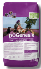
Hundefutter 15kg CHF 63.00