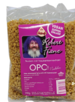
OPC133 Nudeln CHF 3.90