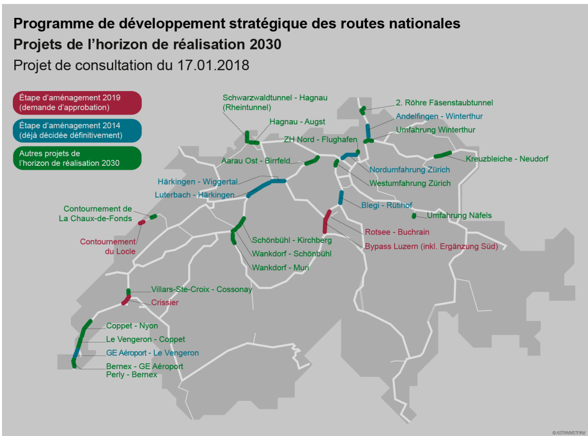
Projets du PRODES affectés à l'horizon de réalisation 2030

Le Conseil fédéral entend maintenir et améliorer le fonctionnement du réseau des routes nationales. Afin d'éviter les embouteillages, les autoroutes devront être aménagées par des mesures ciblées aux endroits névralgiques. Les projets en ce sens font l'objet du programme de développement stratégique (PRODES). Il est prévu d'investir 13,474 milliards de francs d'ici à 2030 pour leur réalisation. Il s'agira principalement de mesures d'extension dans les agglomérations. Quatre projets devraient être adoptés définitivement par le Parlement dans le cadre de l'étape d'aménagement 2019.