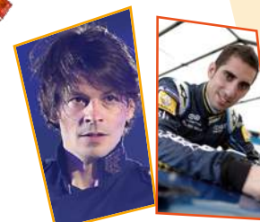
Stéphane Lambiel Sébastien Buemi