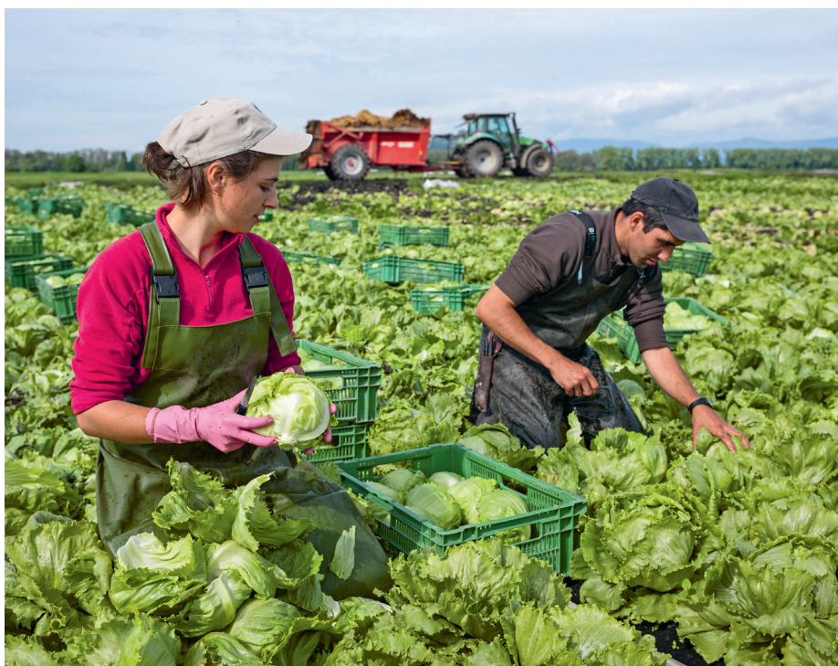
La Suisse attire les Européens du Sud. Travailleurs portugais dans le Seeland.

L'évolution de la composition de l'immigration et de son importance pour le