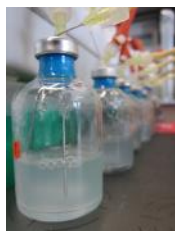
Abbildung 1: Die Bakterienkulturen von Klebsiella oxytoca wurden in sogenannten Chemostaten (kontinuierlichen Kulturen) mit verschiedenen Konzentrationen von Ammonium und mit einem Überschuss an elementarem, gasförmigem Stickstoff ( N_2 ) versorgt. (Copyright: Frank Schreiber)

Download ab www.eawag.ch – honorarfreie Verwendung nur in Zusammenhang mit dieser Mitteilung