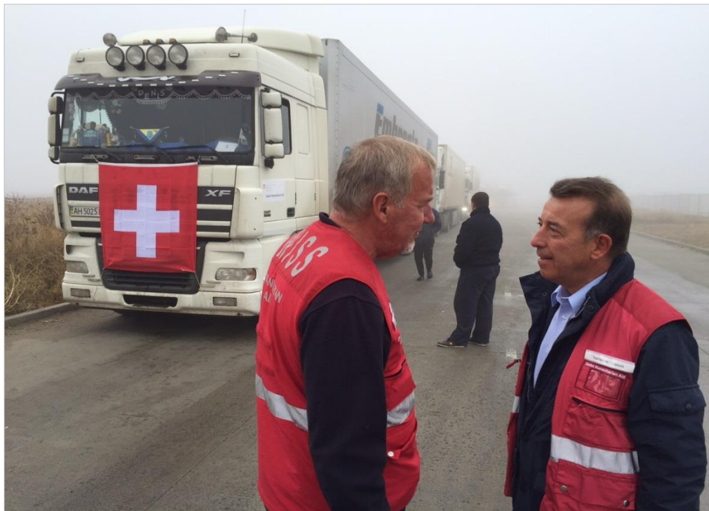
Depuis le mois d'avril 2015, l'Aide humanitaire de la Suisse (DDC/AH) a organisé six convois humanitaires avec des produits pour le traitement de l'eau et du matériel médical dans la région de Donetsk.

Bureau de coopération à Kiev depuis 1999