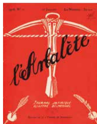
L'Arbalète. Journal satirique, illustré bi-mensuel, 1 (1.7.1916)