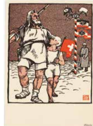
Edmond Bille, Postkarte / Carte postale, 1914 © Fondation Ed. Bille