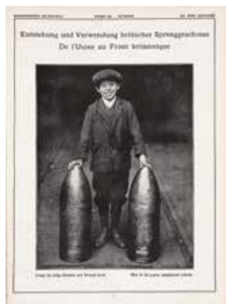
Fertige 9,2 zöllige Granaten zum Versand bereit / Obus de 9,2 pouces complètement achévés , in Illustrierte Rundschau / Le mois illustré (Februar 1918)