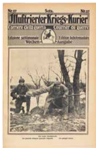
Eine deutsche Schleichpatrouille / Una pattuglia tedesca / Une patrouille allemande (patrouille rampante) , in Illustrierter Kriegs-Kurier / Corriere della guerra / Courrier de guerre , 27 (1918)