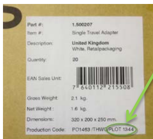
Sul lato esterno della confezione