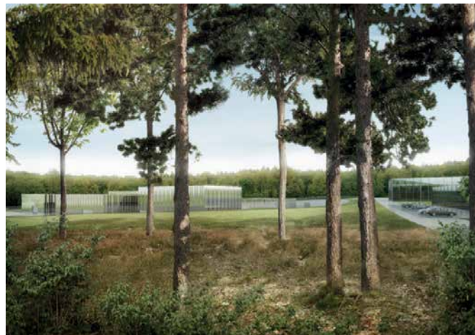
Bild 4: Mögliche Einbindung der Oberflächenanlage in die Umgebung (fotorealistische Darstellung)

Gemäss heutiger Planung erfolgt die Strassen- und Bahnerschliessung ab «Engi», teilweise in Tunnels, über ein neu zu erstellendes Trasse. Die Transporte der SMA-Abfälle und des Ausbruchmaterials sind grundsätzlich per Bahn vorgesehen. Falls z. B. eine nahegelegene Kiesgrube zur Verfügung steht, könnte das Ausbruchmaterial auch per Förderbänder oder LKW dorthin abtransportiert werden.