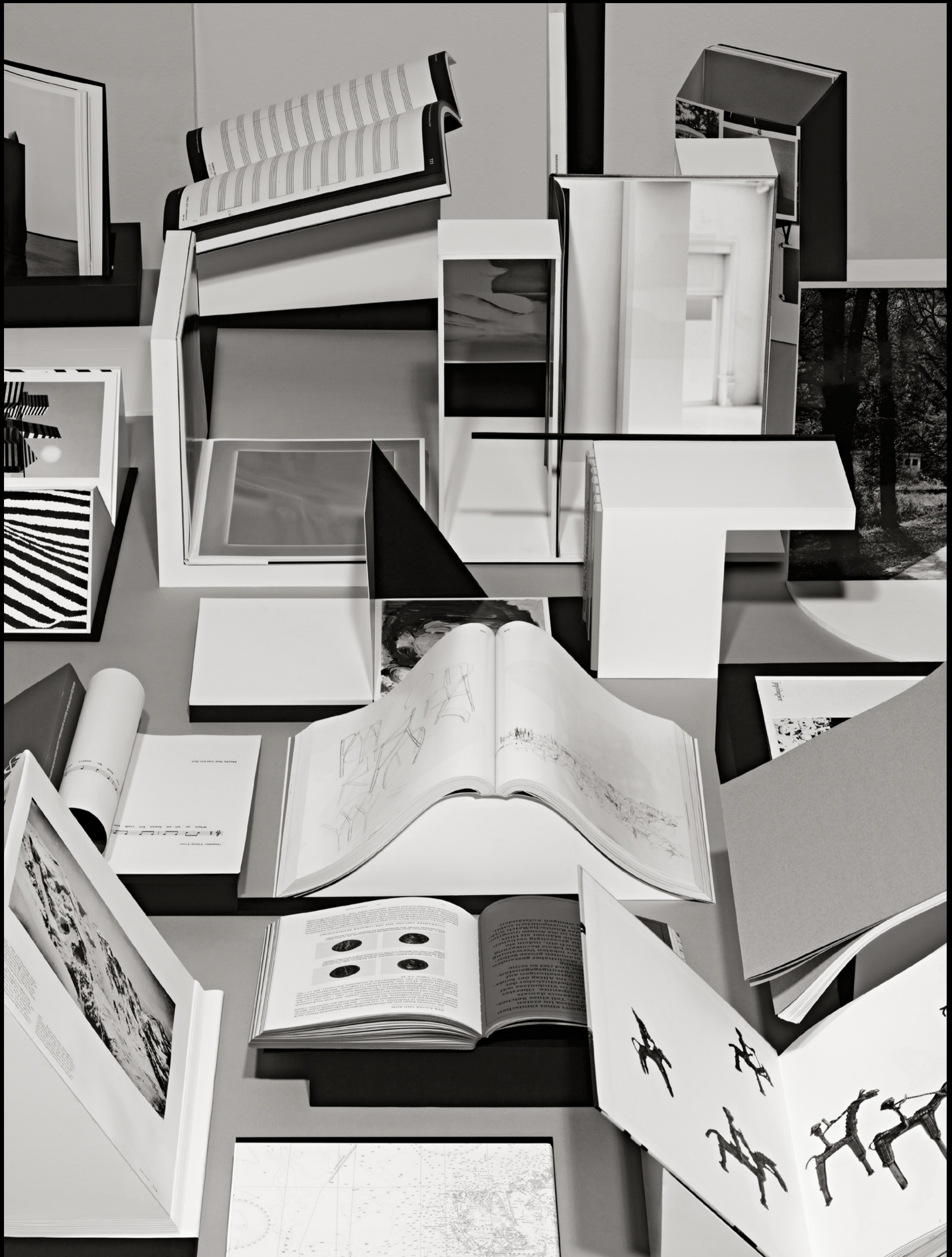
Die schönsten Schweizer Bücher Les plus beaux livres suisses I più bei libri svizzeri The Most Beautiful Swiss Books 2012