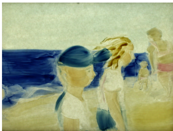
Immagine: Copyright © Academy of Fine Arts & Michaela Müller

Produzione: Academy of Fine Arts, University of Zagreb Ilica 85 HR – 10000 Zagreb Tel: + 385 1 377 73 00 alu@alu-hr www.alu.hr