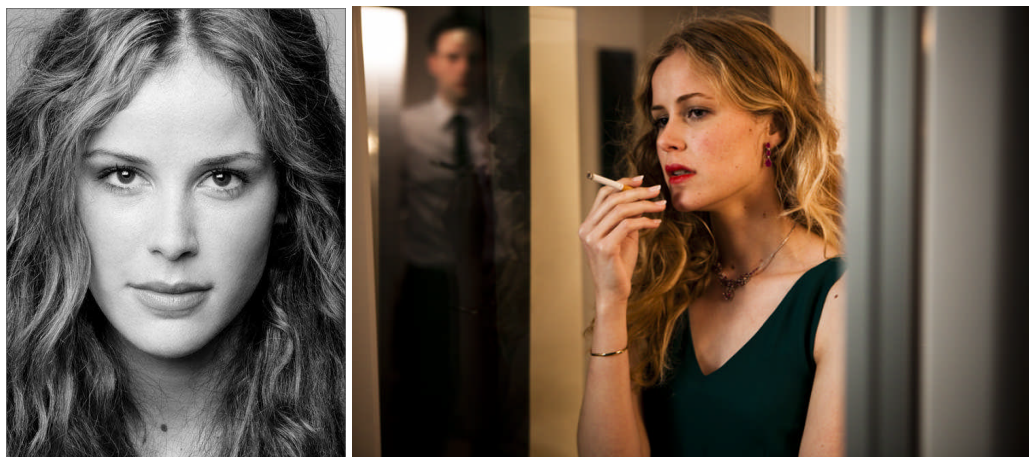
Portrait: Copyright © Tony Thornton/ Image «180°»: Copyright © C-Films

Carla Juri dans le rôle d'Esther dans «180°» de Cihan Inan