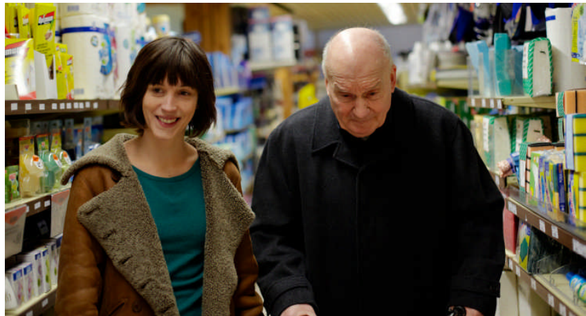
Filmstill: Copyright © Vega Film

Produktion: Vega Film Helenastrasse 3 CH – 8034 Zürich Phone +41/44/384 80 90 Fax +41/44/384 80 99 info@vegafilm.com www.vegafilm.com