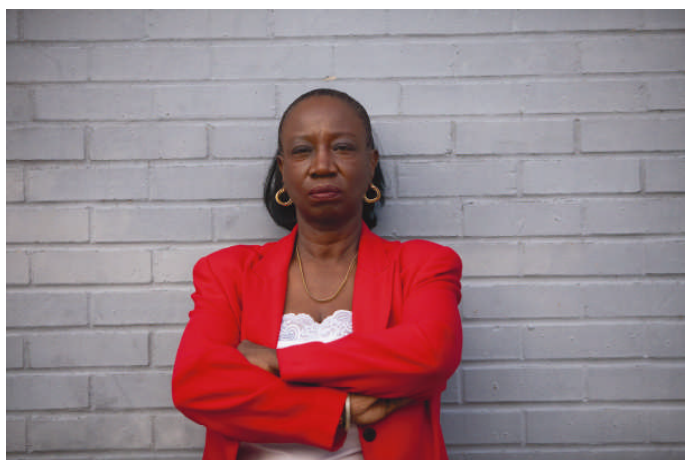
Filmstill: Copyright © SAGA Production

Produktion: SAGA Production Chemin de Montelly 46 CH – 1007 Lausanne Phone +41/21/311 95 70 Fax +41/21/311 95 72 info@sagaproduction.ch www.sagaproduction.ch www.clevelandcontrewallstreet.ch