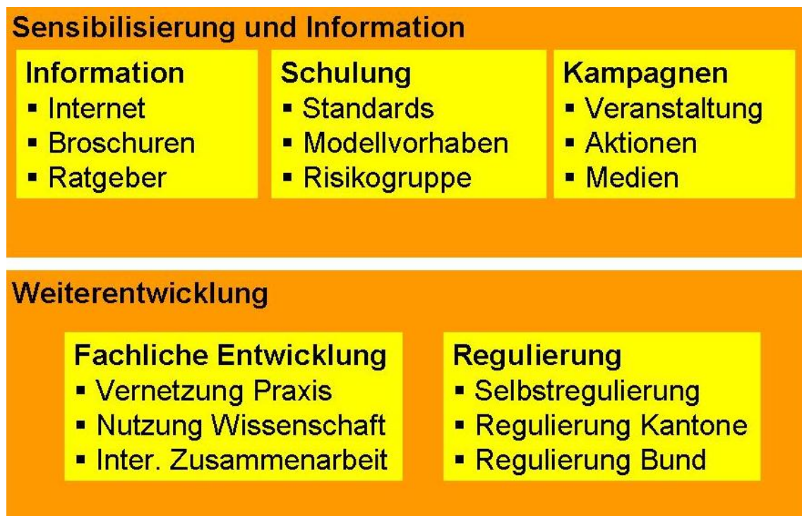
Schaubild 1: Jugendmedienschutz: Module und Massnahmen.

Das Programm hat nicht den Anspruch Massnahmen und Angebote auf allen Ebenen umzusetzen und durchzuführen. Vielmehr geht es darum, auf nationaler Ebene Kriterien, Standards und Qualitätssicherungsinstrumente zu definieren, Neues anzustossen, Lücken zu füllen und den zahlreichen Akteuren Hilfestellungen und Austauschmöglichkeiten anzubieten. Die Umsetzung von Massnahmen zur Förderung von Medienkompetenzen in der Breite soll wie bisher dezentral durch die Anbieter vor Ort erfolgen.