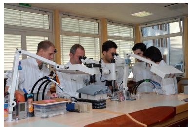
08 - Atelier de haute horlogerie, Manufacture Girard- La Chaux-de-Fonds (Journée du patrimoine horloger 2007)