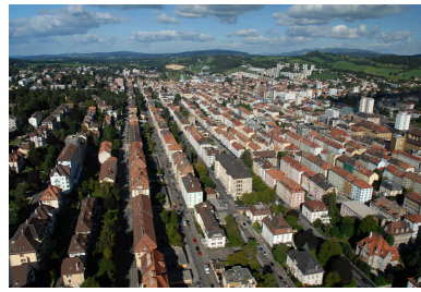
02 - Vue aérienne de La Chaux-de-Fonds