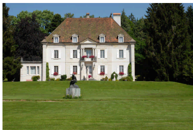
05 – Musée d'horlogerie du Locle (Château des Monts)