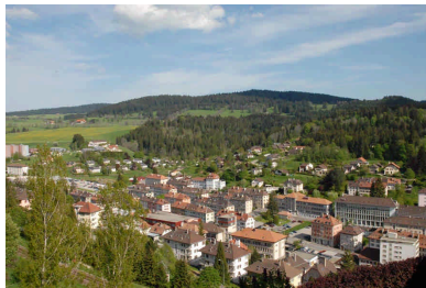
03 - Vue aérienne du Locle