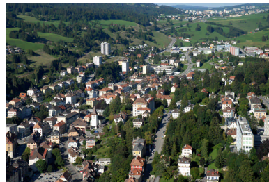
04 - Vue aérienne du Locle