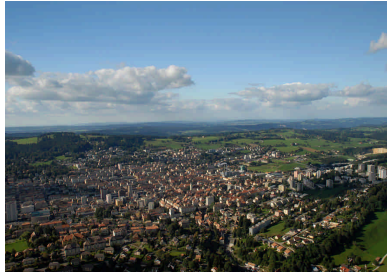
01- Vue aérienne de La Chaux-de-Fonds