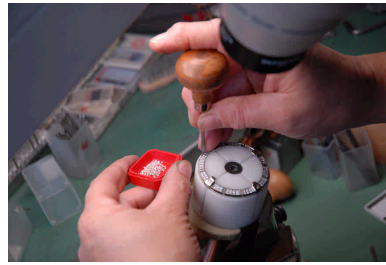
10 – Atelier Quadroni (sertissage), La Chaux-de-Fonds