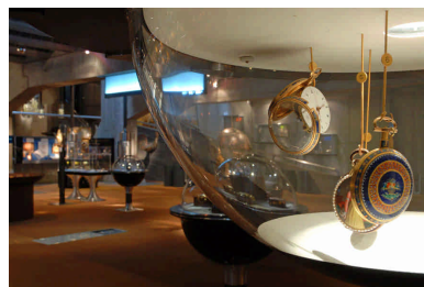
06 – Musée international d'horlogerie (La Chaux-de-Fonds)