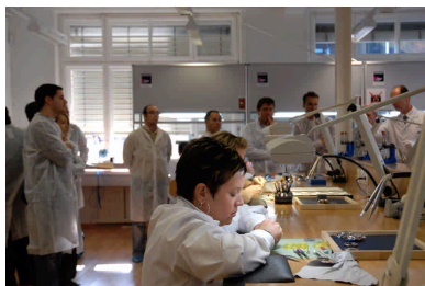
07 - Montres Corum, La Chaux-de-Fonds Perregaux, (Journée du patrimoine horloger 2007)