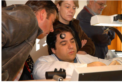
09 – Les Artisans horlogers, Le Locle (Journée du patrimoine horloger 2007)